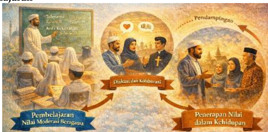
Gambar 2. Visualisasi implementasi nilai moderasi beragama dalam proses pembelajaran

Integrasi nilai moderasi beragama diimplementasikan dalam pembelajaran PAI menunjukkan bahwa implementasi dilakukan melalui perencanaan pembelajaran, strategi pedagogis, serta sistem evaluasi yang mendukung internalisasi nilai. 26 Pada tahap perencanaan, guru PAI memasukkan indikator sikap moderat dalam perangkat ajar. Tujuan pembelajaran yang mencakup kemampuan berpikir kritis, sikap toleran, dan komitmen kebangsaan. Hal ini menunjukkan bahwa integrasi tidak hanya bersifat implisit, tetapi dirancang secara eksplisit dalam dokumen pembelajaran. 27