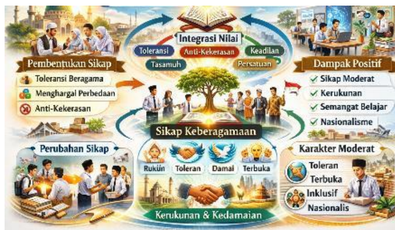
Gambar 3. Visualisasi integrasi nilai moderasi beragama terhadap peserta didik