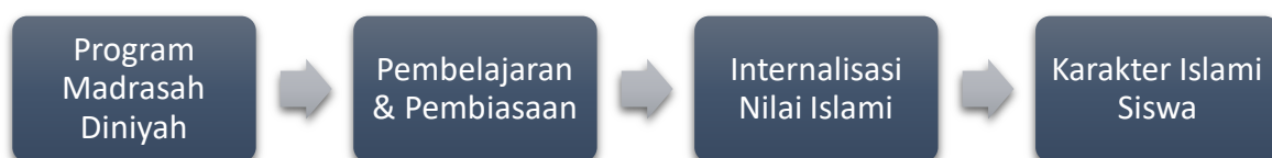
Gambar 1. Kerangka Konseptual Penelitian

Keunikan penelitian ini terletak pada fokusnya yang mendalam terhadap praktik Program Madrasah Diniyah di MTsN 16 Jombang, mencakup pembelajaran Al-Qur'an terstruktur, tahfizul Qur'an, dan kajian kitab yang dipadukan sebagai satu kesatuan pembinaan karakter (Safitri et al., 2023). Penelitian ini tidak hanya mendeskripsikan pelaksanaan program, tetapi juga menganalisis proses internalisasi nilai-nilai karakter Islami dan refleksinya dalam perilaku peserta didik, sehingga memberikan gambaran analitis mengenai peran Program Madrasah Diniyah dalam membentuk karakter Islami (Rini Syevyilni Wisda, 2023).