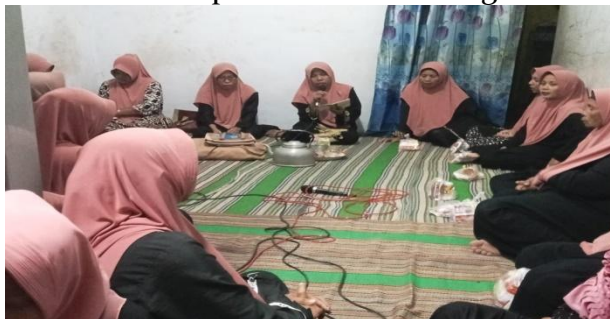
Gambar 1 : Suasana Kegiatan Majelis Taklim Al-Hidayah

Kegiatan rutin Majelis Taklim Al-hidayah dilaksanakan setiap malam Jumat, pukul 18.00 hingga 20.00 WIB, dengan sistem tempat bergilir di rumah-rumah anggota. Adapun susunan acara terdiri dari pembacaan Surat Yasin, tahlil, diba', mau'izhah hasanah, dan arisan sosial. Mau'izhah hasanah diadakan khusus setiap malam Jumat Manis (sekali sebulan), dan diisi oleh tokoh agama setempat atau anggota yang memiliki kompetensi dalam bidang keislaman. Menurut penuturan Kustina, tujuan utama dari kegiatan majelis ini adalah untuk meningkatkan pengetahuan keagamaan, mempererat tali silaturahmi, serta membangun kerukunan antarwarga. Sebelum adanya majelis ini, masyarakat Dusun Krajan relatif kurang dalam hal interaksi sosial dan hubungan kekeluargaan. Namun, setelah terbentuknya Majelis Taklim Al-Hidayah, pola komunikasi antarwarga menjadi lebih terbuka dan akrab. Seorang anggota menyatakan, " Dulu kami jarang saling menyapa atau