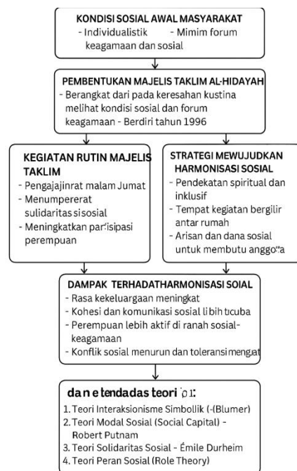
Gambar 2: Bagan Skema Transformasi Sosial melalui Kegiatan Majelis Taklim Al-Hidayah