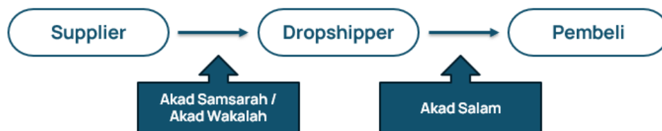
Gambar 1. Penjelasan dari penulis

Salah satu tantangan utama dalam dropshipping adalah kurangnya kejelasan dalam akad antara supplier, dropshipper, dan pembeli. Ketidaktepatan ini dapat menyebabkan ketidakpuasan konsumen dan potensi sengketa hukum. 46 Untuk mengatasi tantangan ini, perlu dibuat perjanjian tertulis yang mencakup hak dan kewajiban semua pihak yang terlibat. Semua informasi barang dan ketentuan fee harus dituangkan secara jelas dalam akad.