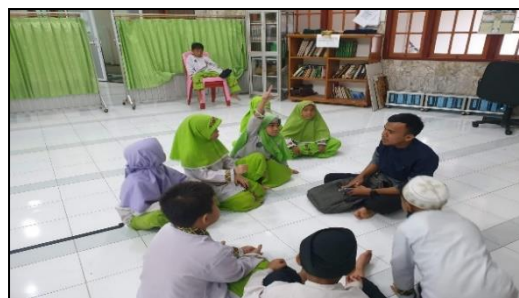
Gambar 3. Metode Pendekatan Guru dalam Program Didikan Subuh

Berdasarkan kutipan wawancara tersebut peningkatan kualitas ibadah anak tidak bisa terlepas pada metode dan pendekatan yang interaktif dan bervariasi yang digunakan oleh guru, serta disesuaikan pada kondisi anak untuk dapat lebih semangat dalam mengikuti program didikan subuh, dan hal ini juga terdeskripsi pada data dokumen berikut: