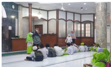
Gambar 2. Kegiatan Peranan Guru

Oleh karena itu, guru sebagai sentral dalam kegiatan ini dengan komitmen yang utuh maka program kegiatan didikan subuh dapat berjalan dengan lancar. Hal ini juga terlihat pada saat observasi bahwa guru sangat komitmen dalam pelaksanaan kegiatan program didikan subuh yang, sebagaimana dokumentasi berikut: