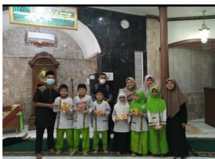
Gambar 5. Kegiatan Evaluasi dan bentuk Dukungan Orangtua

Kerjasama atau dukungan orangtua dalam menyukseskan program didikan subuh menjadi kunci keberhasilan program ini, sehingga tidak hanya berpatokan pada guru saja namun juga orangtua memiliki peran yang aktif dalam mengingatkan anak, sebagaimana evaluasi yang dilakukan guru untuk mengajak orangtua berdiskusi dan menjalin kerjasama, hal ini juga sesuai pada dokumentasi saat akhir program untuk evaluasi, sebagai berikut: