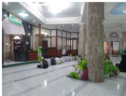
Gambar 4. Deskripsi Efektivitas Kegiatan Program Didikan Subuh

Sesuai dengan kutipan wawancara di atas, program didikan subuh adalah program yang disusun untuk melatih anak untuk belajar lebih lanjut, dengan berbagai rangkaian acara yang dilakukan dengan tema agama dan pemberian tugas yang dilakukan oleh guru sehingga efektivitas kegiatan didikan subuh menjadi alternatif dalam membantu anak untuk belajar khususnya peningkatan kualitas ibadah untuk lebih baik lagi, sebab didikan subuh juga mendorong anak terus mengulang pembelajaran yang telah diajarkan oleh guru, sebagaimana juga pada dokumentasi kegiatan, sebagai berikut: