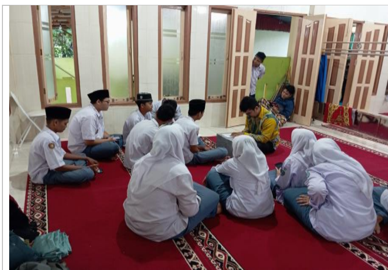
Gambar 1. Suasana Penyetoran Surat