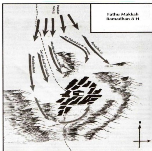
Gambar 1. Ilustrasi peta Fathu Mekah

Ilustrasi peta diatas menunjukkan kronologis peristiwa fathu mekah, diantara penglima perang dan pembagian tugas dalam pembebasan kota mekah adalah: