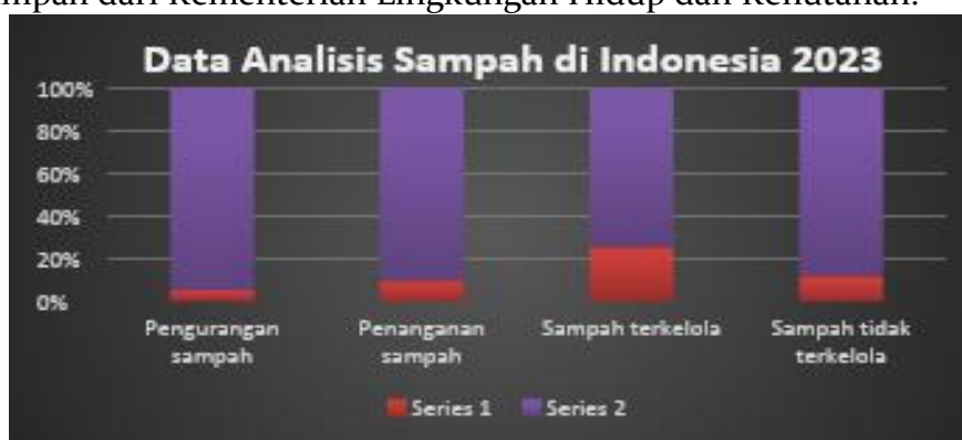
Gambar. 1 Data Analisis sampah Indonesia

Sampah adalah masalah utama yang dihadapi oleh sebagian besar masyarakat di Indonesia. Populasi sampah meningkat hanya dalam kurun waktu setahun yang mengakibatkan lingkungan kumuh, menjadi sumber sarang penyakit dan dapat memicu pemanasan global (Rahmat, 2023, hlm. 122). Berikut terdapat gambar data analisis Sampah dari Kementerian Lingkungan Hidup dan Kehutanan.