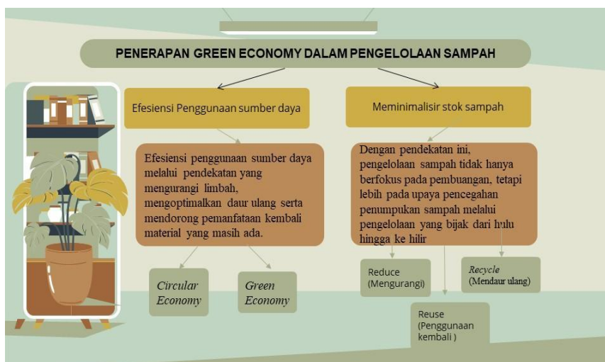
Gambar. 3 Penerapan Green Economy dalam pengelolaan Sampah