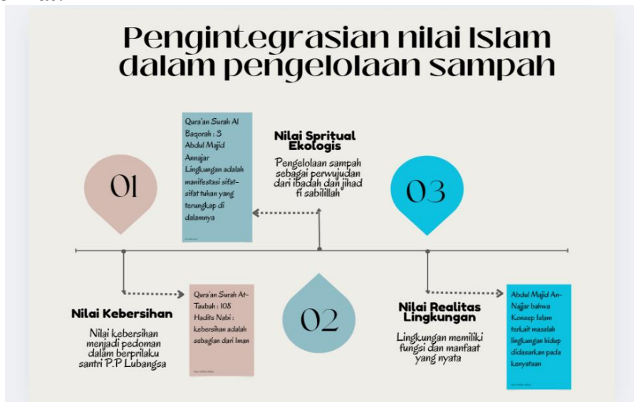
Gambar. 2 Integrasi nilai-nilai Islam dalam pengelolaam Sampah

maupun kehidupan sosial yang lebih luas. Agar mempermudah pembaca dalam memahami pengintegrasian nilai-nilai Islam dalam pengelolaan sampah berbasis Green Economy maka peneliti membuat grafik kesimpulan terkait hal tersebut sebagai berikut: